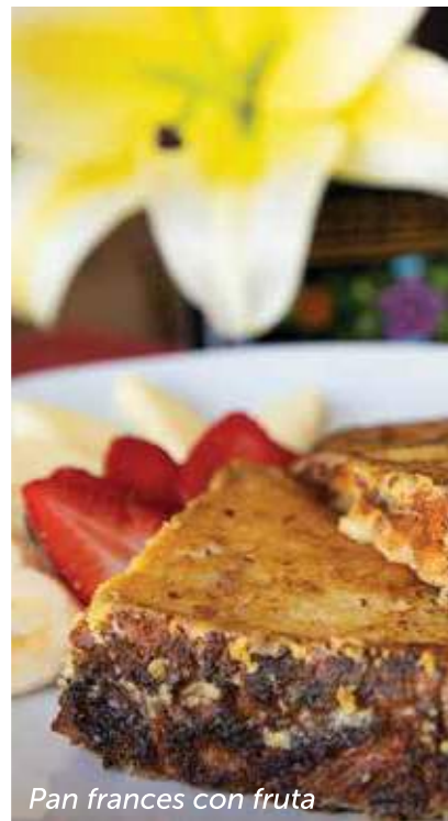
Pan francés con fruta