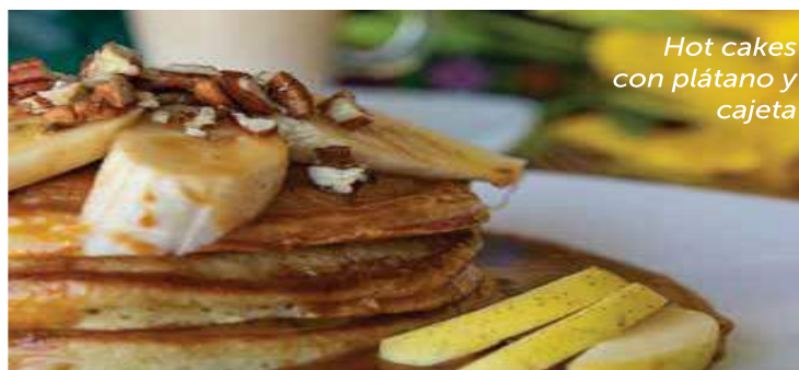
Hot cakes con plátano y cajeta

Tazón de yogurt con frutas y granola $95 Yogurt natural con trocitos de fruta de temporada, miel natural y granola.