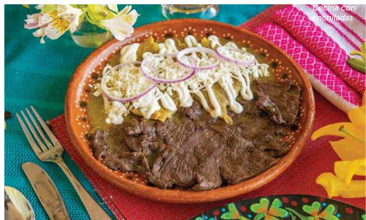
Cecina con enchiladas